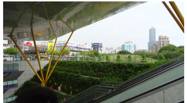
Gare de Central Park