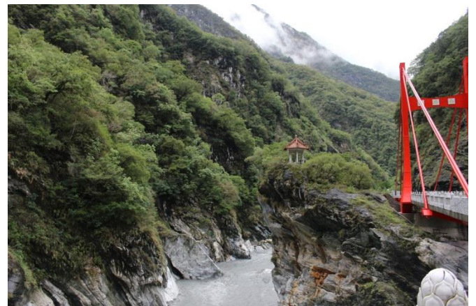
Parc National de Taroko à Hualien