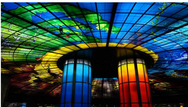
Gare de Formosa Boulevard